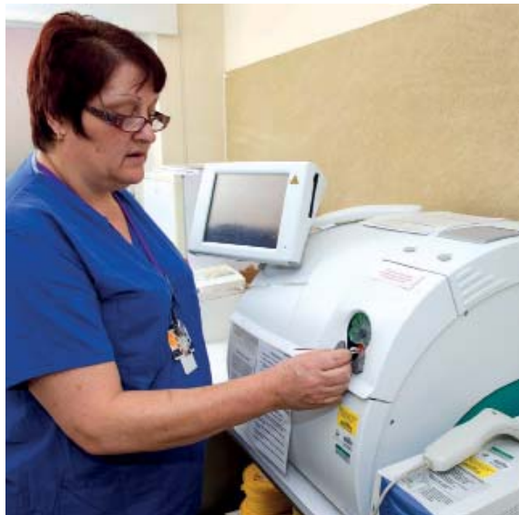
Medizinische Praxisassistentin bei der Analyse einer Blutprobe.

Troponin T ist ein anerkannter Marker für die Diagnose des akuten Koronarsyndroms. In welchen Fällen ist eine Troponin-T-Bestimmung neben der obligaten EKG-Untersuchung angezeigt?